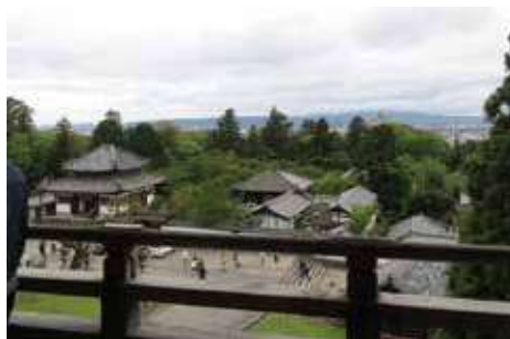
東大寺 二月堂からの眺め