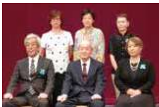
表彰された方々と戸利会長 (前列中央)