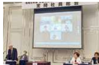
WEBで全国ネット配信しました。