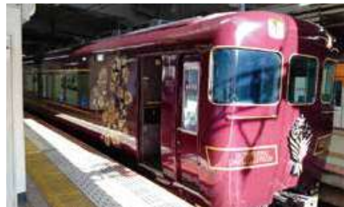
観光列車「あおによし」

奈良では、世界遺産に登録された「春日大社」から「東大寺」へ。鹿とたわむれ、宿は「春日ホテル」。翌日は、バスで「法隆寺」へ。天平時代の国宝や重要文化財に触れ、悠久の歴史に思いをはせました。