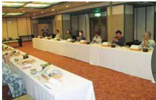
奈良・懇親会の様子