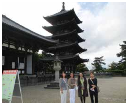
興福寺の五重塔の前で