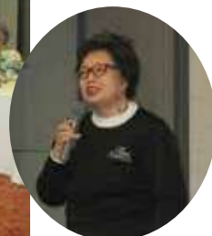
白根所長研修会会長