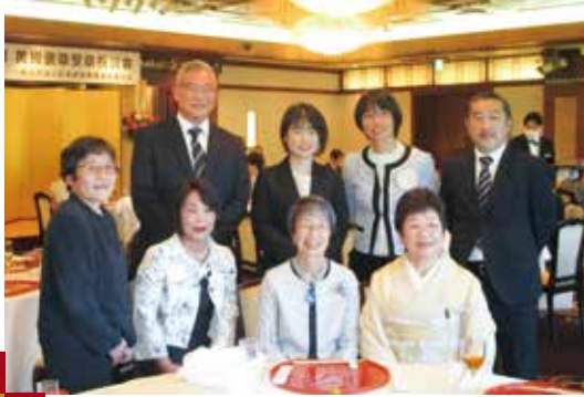
ご友人たち、ご家族と