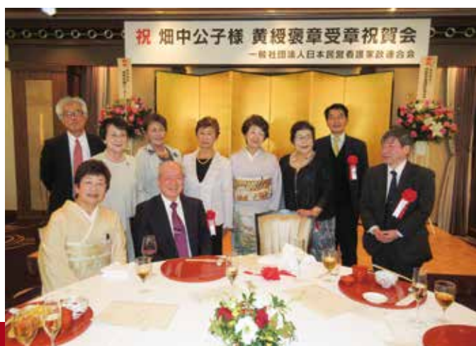
戸刈会長はじめ、ご来賓の方々と