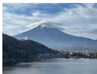
河口湖から“笠雲の富士”を望む

富士山周辺は東京から行っても遠くなく1泊2日でも十分楽しめます。先に挙げたところ以外にも富士